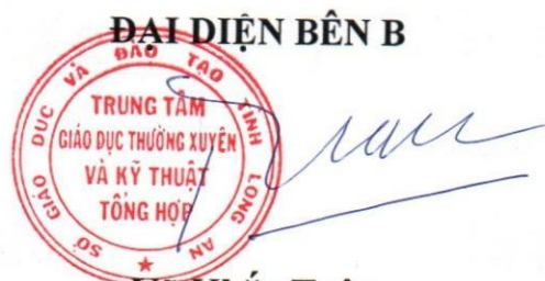
Võ Khắc Tuấn